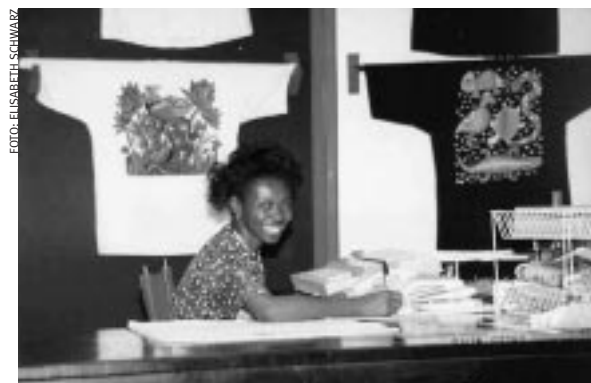
Popige T-Shirts – gestaltet von afrikanischen Künstlern für den Export nach Europa und in die USA – werden unter fairen Arbeitsbedingungen von der DeZign Inc. in Harare/Simbabwe produziert. Finanziert wird das Unternehmen dank Darlehen der Ökumenischen Entwicklungsgenossenschaft Oikocredit – mit ethisch-ökologischen Geldanlagen aus dem Norden der Erde.