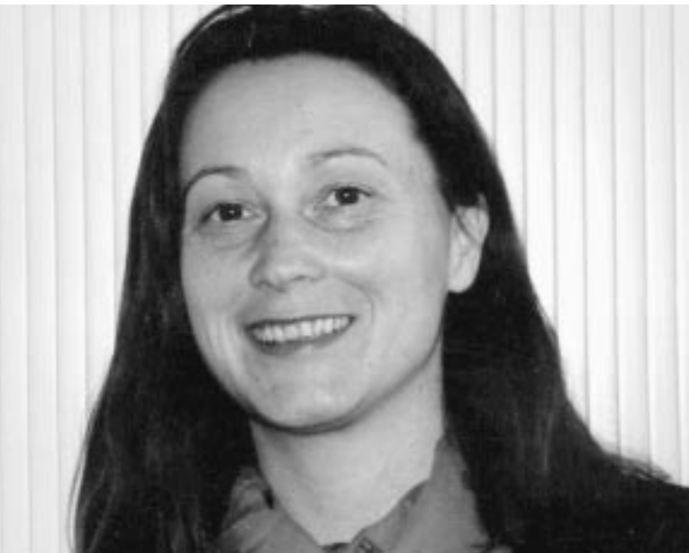
Prof. Brigitte Fuchs

tion auswirken. So lässt etwa der muslimische Glaube bestimmte Krebsformen weniger aufkommen als der christliche Glaube. Die Zusammenhänge sind noch nicht genau geklärt. Aber man geht davon aus, dass diese unterschiedliche gesundheitsfördernde Wirkung von Religionen mit den unterschiedlichen Lebensregeln zusammenhängt, die die Religionen den Gläubigen abfordern.