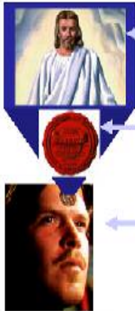
Wir aber haben Christi Sinn. 1 Kor 2:16

Binde zu das Zeugnis, versiegle das Gesetz meinen Jüngern. Jes 8:16 Beschädigt die Erde nicht noch das Meer noch die Blume, bis wir versiegeln die Knechte unsers Gottes an ihren Stirnen! Offb. 7:3 ... und mit ihm hundertvierundvierzigtausend, die hatten seinen Namen und den Namen seines Vaters geschrieben an ihre Stirn. Offb. 14:1